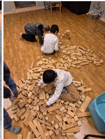
konstruksjonsleik . 3-4 trinn