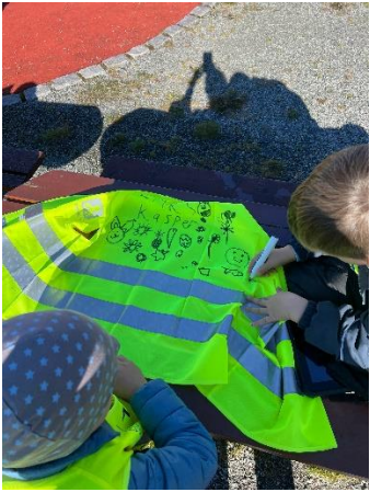
Ut på tur aldri sur, fysisk aktivitet og rørsleglede – 1.