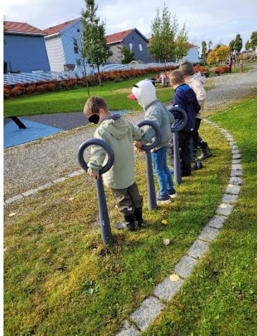
venner, samhald, inkludering