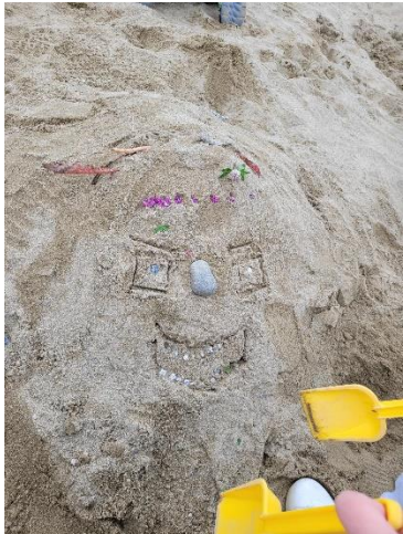
Uteleik – kreativitet