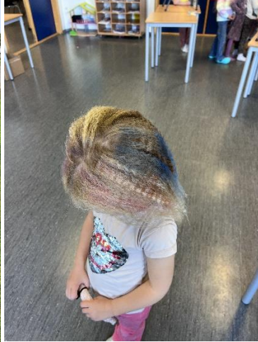
spadag – glede og velvære 1.trinn