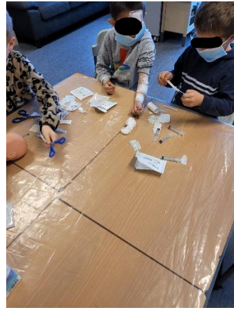
Kleppe skule legekantor/rolleleik: 2.trinn