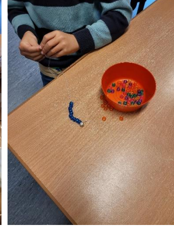
Perling/ kreativitet 2. trinn